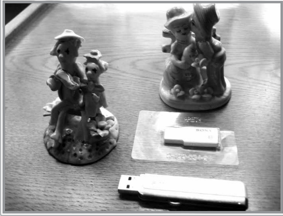
2 ve 8 GB kapasiteli 2 adet Flash Disk (ODTÜ'deki ilk bilgisayar kapasitesinin 50.000 ve 200.000 katı kapasiteli flash diskler), 2013