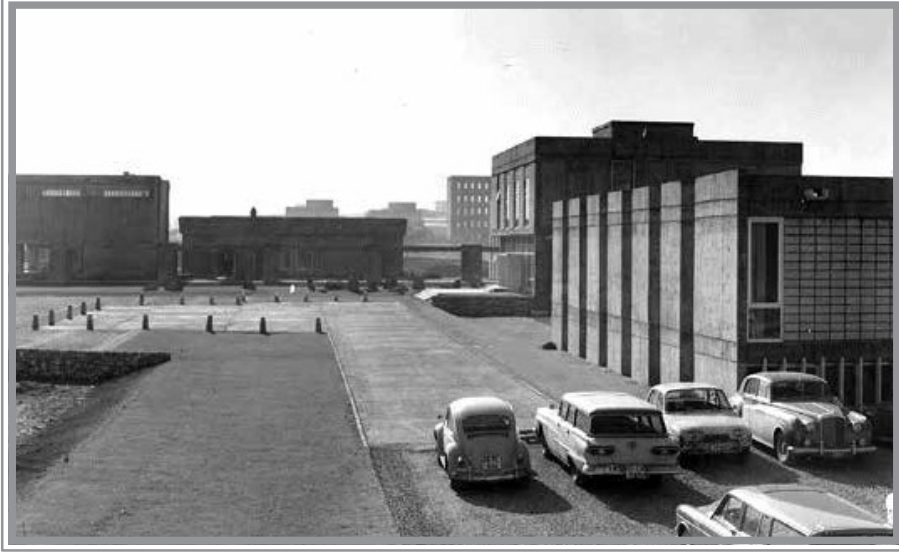
ODTÜ Mimarlık Binası, Hazırlık Okulundan sonra tüm öğrencilerin okuduğu ilk binalar grubu, 1963