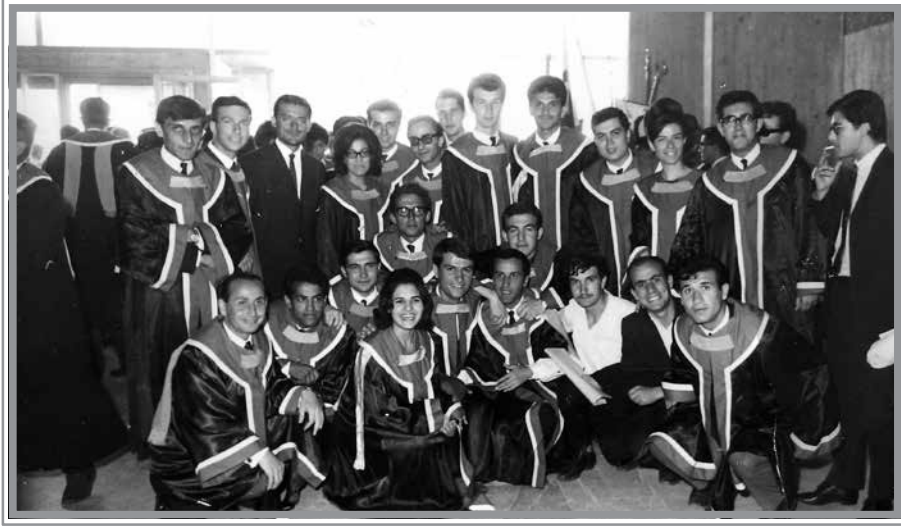
ODTÜ İnşaat 1967 Yılı Mezunlarının Bir Bölümünün Mezuniyet Töreni Sonrası Toplu Fotoğrafı, 1967

ile neden daha önce arkadaşlığımızı ilerletmediğimi sorgularken, üniversiteden mezun olduğumuzu öğrendiğimiz günün gecesinde bir arkadaşımızla birlikte kaldığı Emek semtindeki evde banyoya girmiş, gazdan zehirlenerek ölmüştü. Ankara'ya gelen Babası ve Süha SEVÜK ile birlikte cenazesini kiraladığımız bir araç ile İzmir'e götürmüş, bu husus en kötü anılarımdan bir tanesi olmuştu.