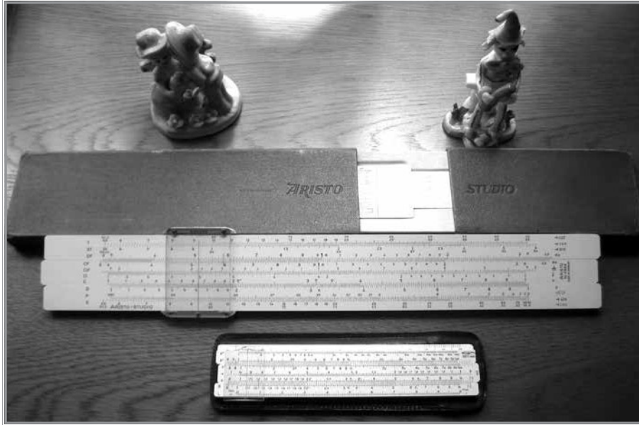
Aristo Marka Kayar Cetvel (slide rule) ve Bir Başka Marka Kayar Cetvel Birarada, 1964