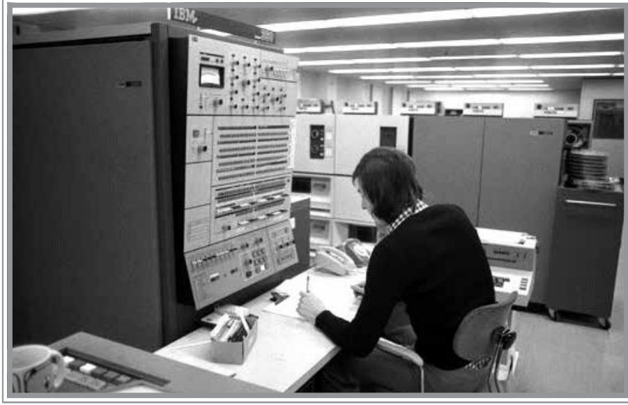
IBM 360 Bilgisayar, 1965