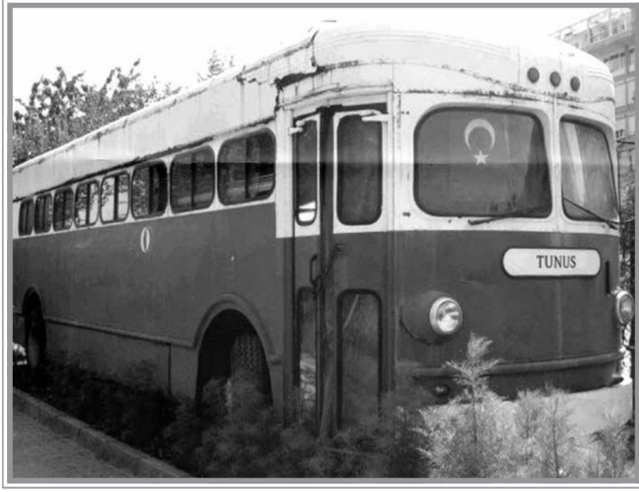
Et arabası dediğimiz şehre gelip gittiğimiz otobüslerden bir diğeri, 1962

Sabah sınava geldik, sınıfın arkalarında kendimize yer ayarladık. Hocamız geldi, soruları dağıttı ve yerine oturdu. Sınıfımız birisi önde diğeri arkada olmak üzere iki kapılı idi. Bizler de kitap ve defterlerimizi kucağımıza koyarak kopya çekmeye başladığımızda birden sınıfın ön kapısından çelik dersi hocamızın hırsla ve hızla içeri girdiğini gördük. Eyvah, Çin’li hoca kopya çekeceğimizi düşündüğünden kendisine yardımcı olarak herhalde çelik dersi hocamızı çağırmış diye düşünüyorduk. Çelik dersi hocamız hızla arka sıralara koşuyordu ve bir arkadaşımızı yakalamaya çalışıyordu. Birçoğumuz arka sıralarda kimin olduğunu göremiyor, neler olduğunu anlamaya zorlanıyorduk.