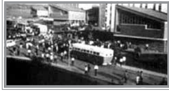
ODTÜ'de Eski Otobüslerden bir tanesi ODTÜ'de durakta, 1962