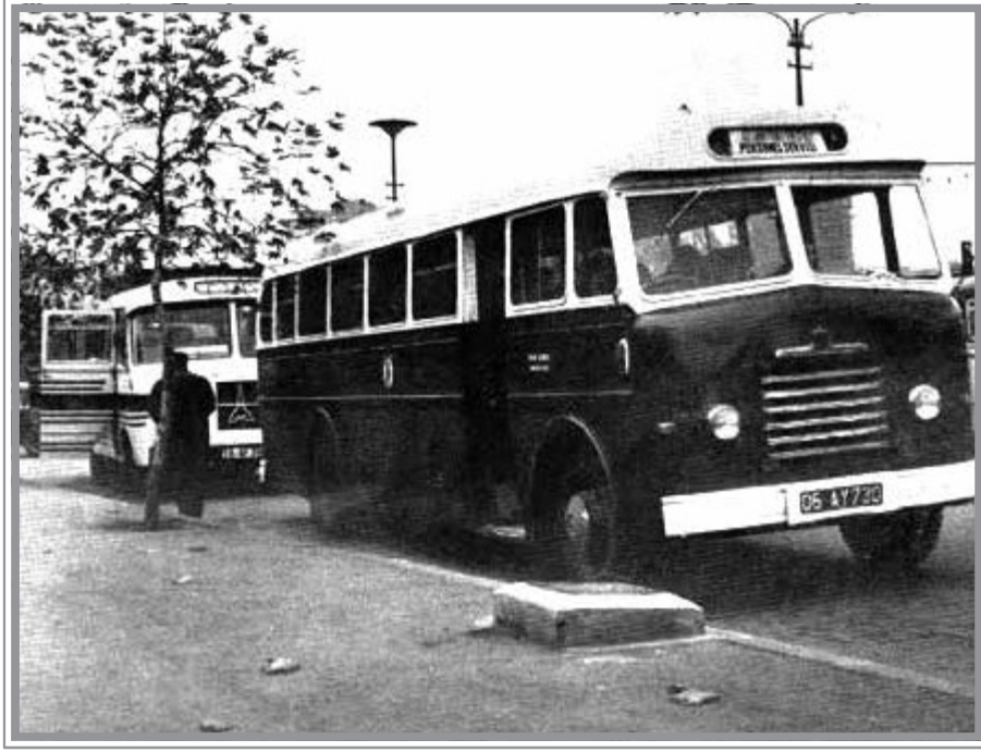
ODTÜ Eski Otobüsleri İçişleri Bakanlığı Önünde Beklerken, 1962

Sonunda kovalanan arkadaşımız hariç, hepimiz, Çin’li hocanın dersinden geçer not almıştık. Sadece bir başka arkadaşımız kopya çekmemiş, kopya çekmek istese bile beceremeyecek bu arkadaşımız sınava sonradan tekrar girerek en iyi notu bu Çin’li hocamızdan almıştı.